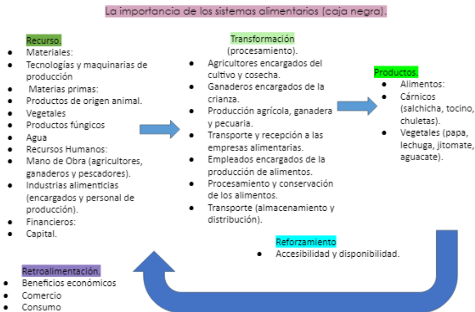
Fig.2. Esquema de la importancia de los sistemas alimentarios (caja negra).