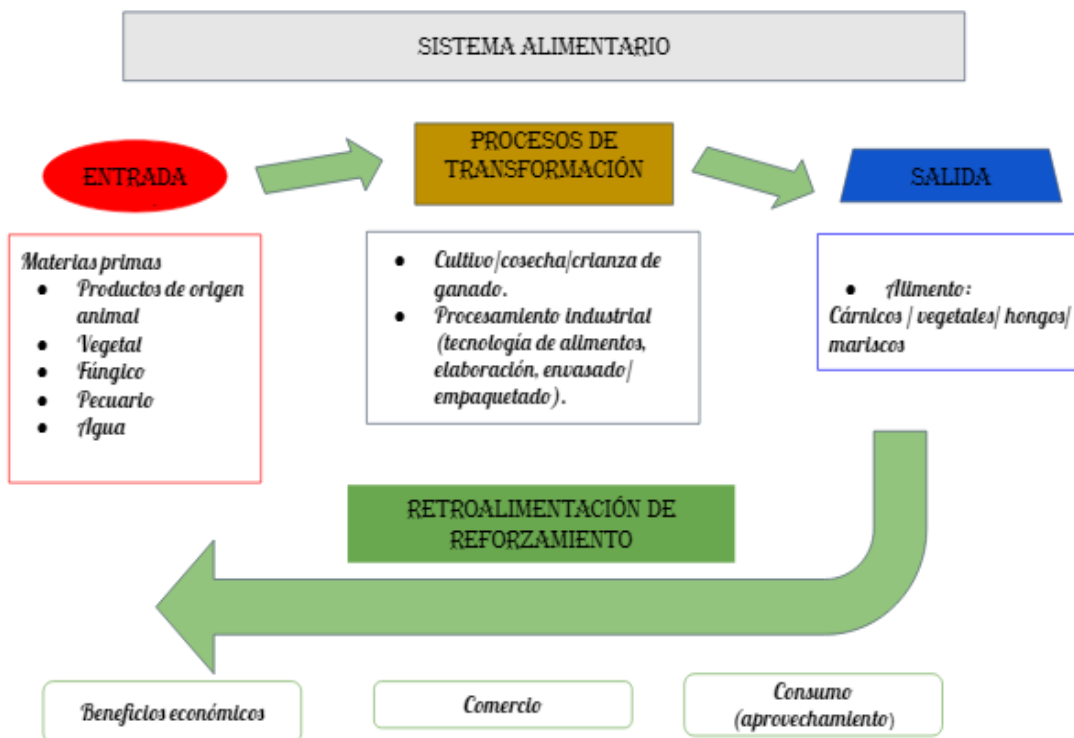
Fig. 1. Entradas y salidas del sistema alimentario.